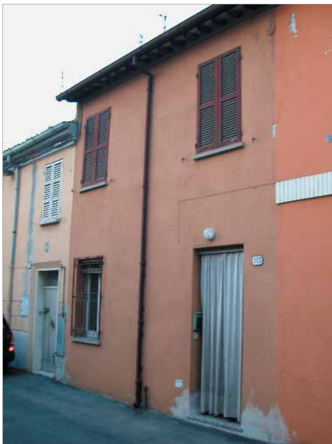
Via Berti 115 Fronte Principale